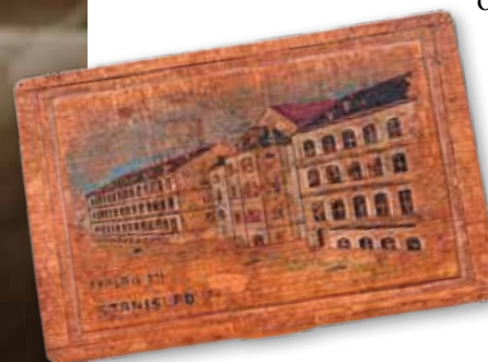
DE ZILVEREN STEMPELHOUDER VAN KEES HAREMAKER (87)

"Ik bewaar een klein houten kistje dat mijn vader tijdens de oorlog in krijgsgevangenschap maakte. Jarenlang zat hij gevangen in een kamp in Nederlands-Indië. Hij maakte het als cadeautje voor mijn moeder, die thuis zat met twee kleine kinderen." Het kistje werd vanuit het kamp opgestuurd en stond daarna altijd in huis. Toch werd er nauwelijks over de oorlog gesproken. "Voor mijn vader was het: als je het niet benoemt, dan is het er niet." Pas veel later hoorde Anne-Marie via een oud-kampgenoot hoe haar vader zich in het kamp staande hield. Terwijl anderen vooral bezig waren met overleven, vluchtte hij in muziek, geschiedenis en kunst. "Dat kistje hoort daar ook bij." Daardoor kreeg het voor haar steeds meer betekenis. Niet alleen als herinnering aan haar vader, maar ook aan alles wat na de oorlog onuitgesproken bleef. "Als ik ernaar kijk, denk ik aan de stille nasleep van oorlog. Aan dingen waar nooit woorden voor kwamen."