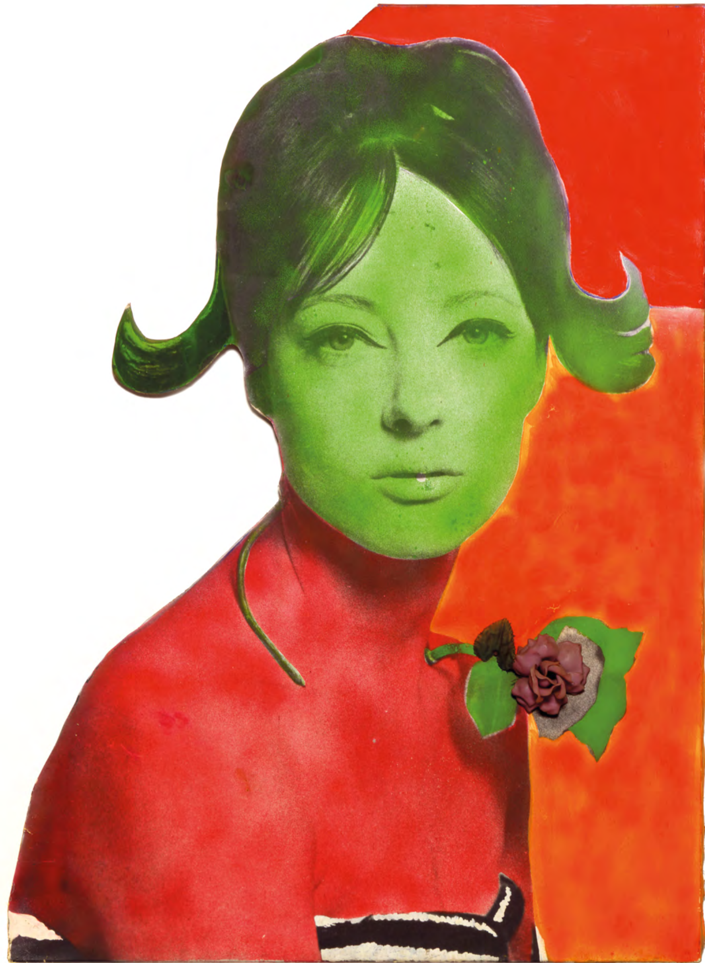
• Links: Martial Raysse 'Miss Nice' (1963). Fotocollage, acrylverf en kunststof op hout, 145,6 cm x 106 cm. Schenking, 1983. • Boven: Tom Wesselmann 'Great American Nude #45' (1963). Collectie S.M.A.K. - Flemish Community, uit de Matthys-Colle Collection © Sabam, België 2021.