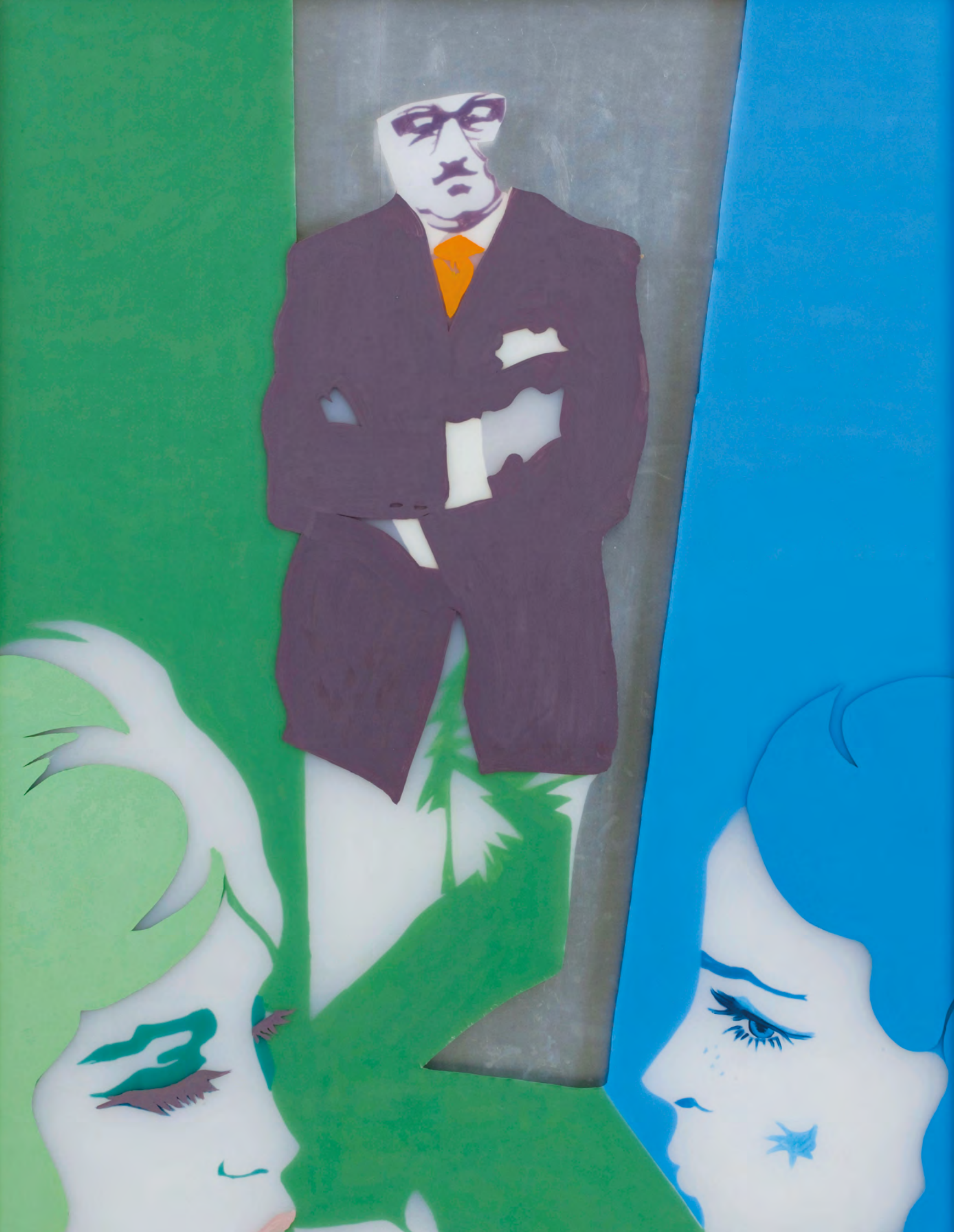
• Evelyne Axell 'Esprit Critique' (1970). Olieverf op plexiglas en hout. 162,5 cm x 112 cm. Bruikleen privécollectie, België.