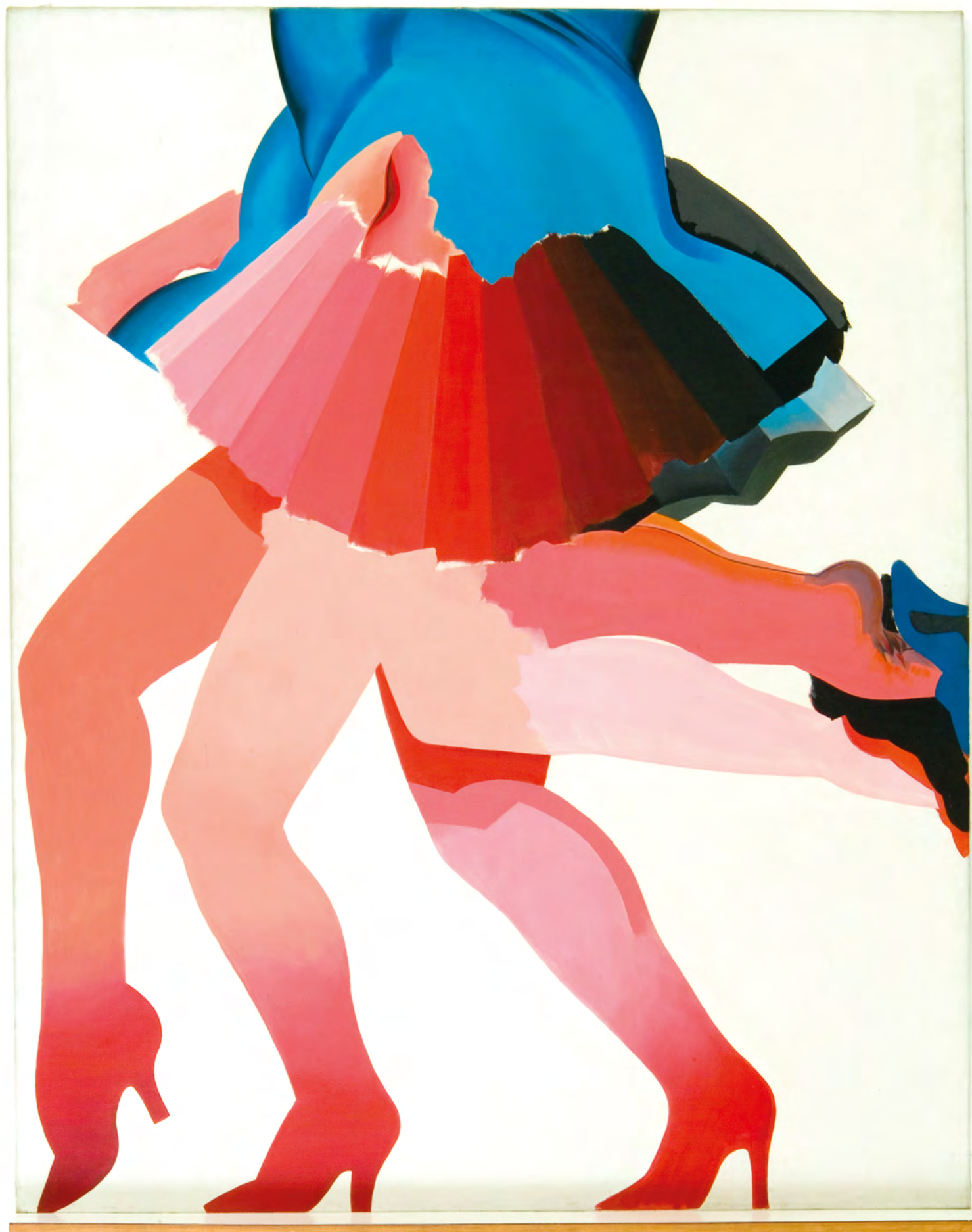
• Links: Allen Jones 'Neither Forget Your Legs' (1965). Olieverf op doek, 128,5 cm x 101,5 cm. Overdracht 1975. • Boven: Tom Wesselmann 'Great American Nude #72' (1965). Bruikleen Collectie Matthys-Colle.