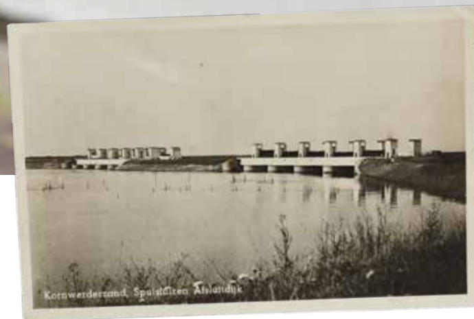
Aanleg van de Spuisluizen aan 't Kornwerderzand.