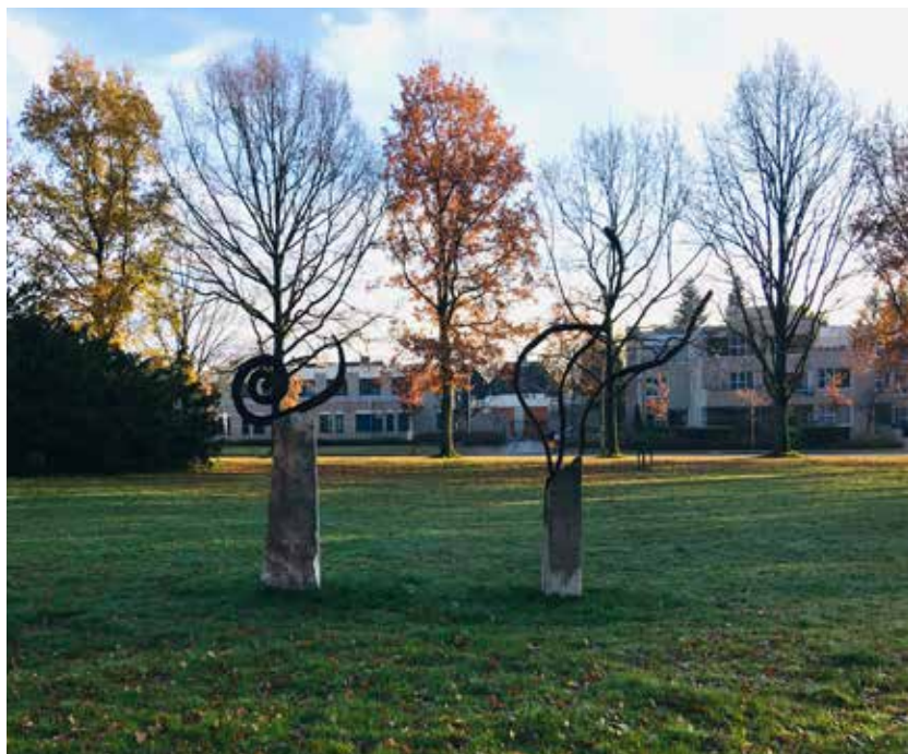
Hendrik de Vries-plantsoen in Haren