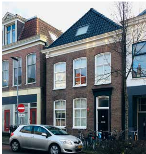
Het geboortehuis van De Vries in de Rapenhauptstraat

In 1910 ging hij naar de Rijks Hogere Burgerschool >