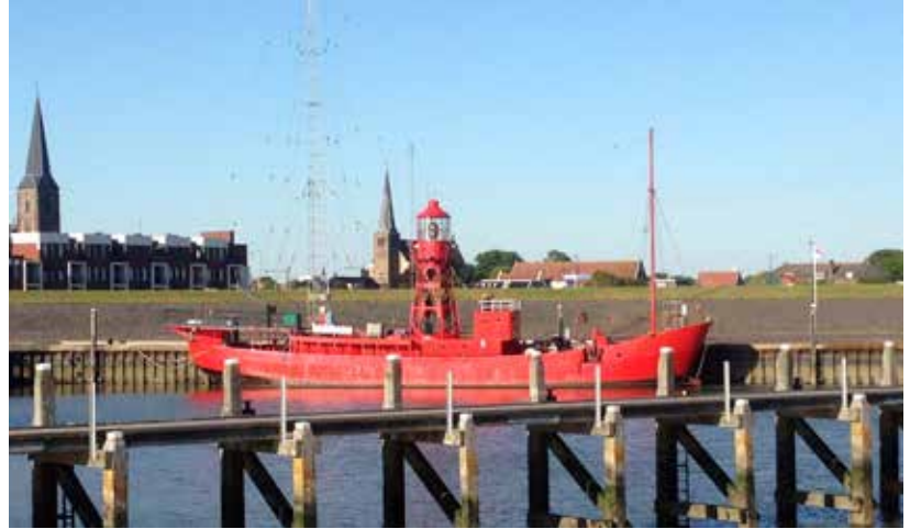
Lichtschip Jenni Baynton ligt aan de kade in Harlingen

gebouwd, in opdracht van Trinity House, de Engelse Rijkswaterstaat. Het deed 40 jaar lang dienst als drijvende vuurtoren in de monding van de Theems. Duizenden schepen wist ze in weer en wind veilig langs de gevaarlijke zandbanken voor de Engelse kust te brengen. De ogenschijnlijk onoverwoestbare Jenni Baynton eindigde als discotheek Barocca in Rotterdam en werd vervolgens jammerlijk verwaarloosd. Omdat het niet meer aan de brandeisen voldeed, wilde de eigenaar er vanaf.