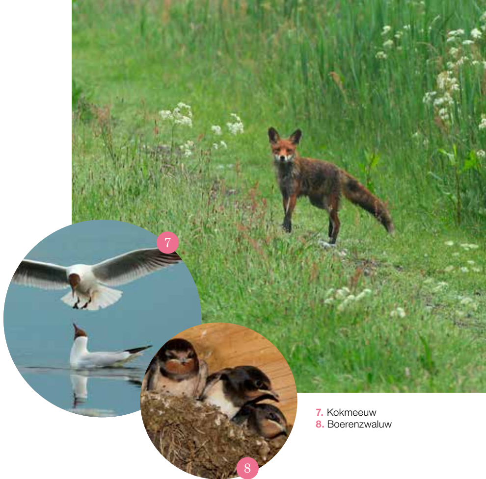
7. Kokmeeuw 8. Boerenzwaluw

Johan zette op 7 meter afstand van de hut nog een extra boom neer. 'Deze landingsplek staat op fotografische afstand; een mooie attractie voor natuurfotografen. In het voorjaar heb ik er veel koekoeken kunnen fotograferen.'