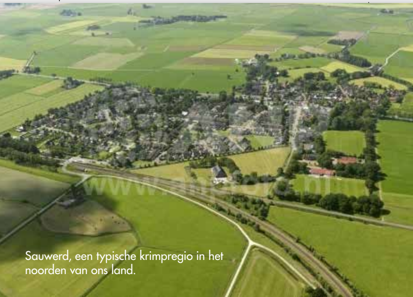
Sauwerd, een typische krimpregio in het noorden van ons land.

voordat het te laat is en er samen iets van maken. “Het is ook belangrijk om de identiteit van een dorp te versterken en burgers te betrekken bij nieuwe ideeën. Als mensen zich weer met hun dorp kunnen identificeren, geeft dat de energie om verder te gaan. Ze moeten iets hebben wat ze houvast geeft. Samen een supermarkt of een buurthuis runnen zijn daar goede voorbeelden van.” Elzerman wijst er wel op dat dorpen niet met elkaar moeten gaan concurreren. “Als het ene dorp een supermarkt heeft, heeft het geen zin om in een dorp dat er vlak naast ligt zoiets te beginnen. Kies dan voor iets anders: een groenteboer, een bakker of kapper. Zo kunnen dorpen elkaar versterken. Dat regionaal samenwerken is cruciaal, maar helaas niet altijd het eerste waar lokale politici aan denken.”